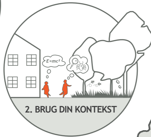
2. BRUG DIN KONTEKST