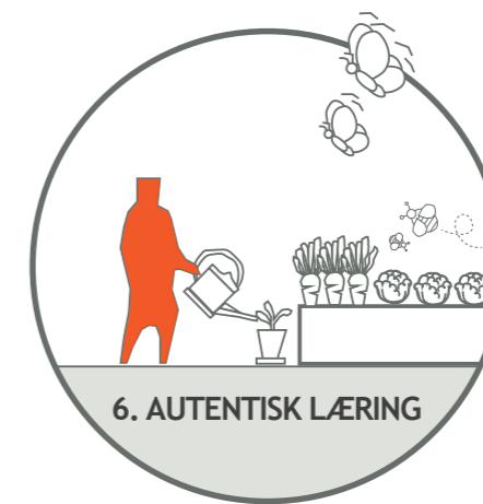
6. AUTENTISK LÆRING