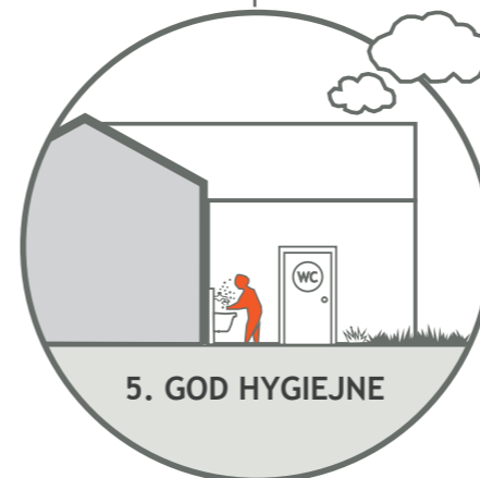
5. GOD HYGIEJNE